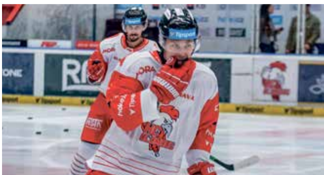
Hokejisté HC Olomouc mají další posilu.