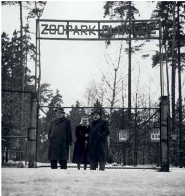
Počátky ZOO v padesátých letech.

Na začátku 50. let minulého století vznikl ve Smetanových sadech v centru Olomouce malý provizorní zookoutek se zástupci lokální zvěře - jeleny, srnci, pávy, bažanty a andulkami. Velký ohlas u veřejnosti (zejména u dětí) přiměl tehdejší krajský národní