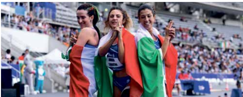
V Olomouci se uskuteční světový závod para atletů.