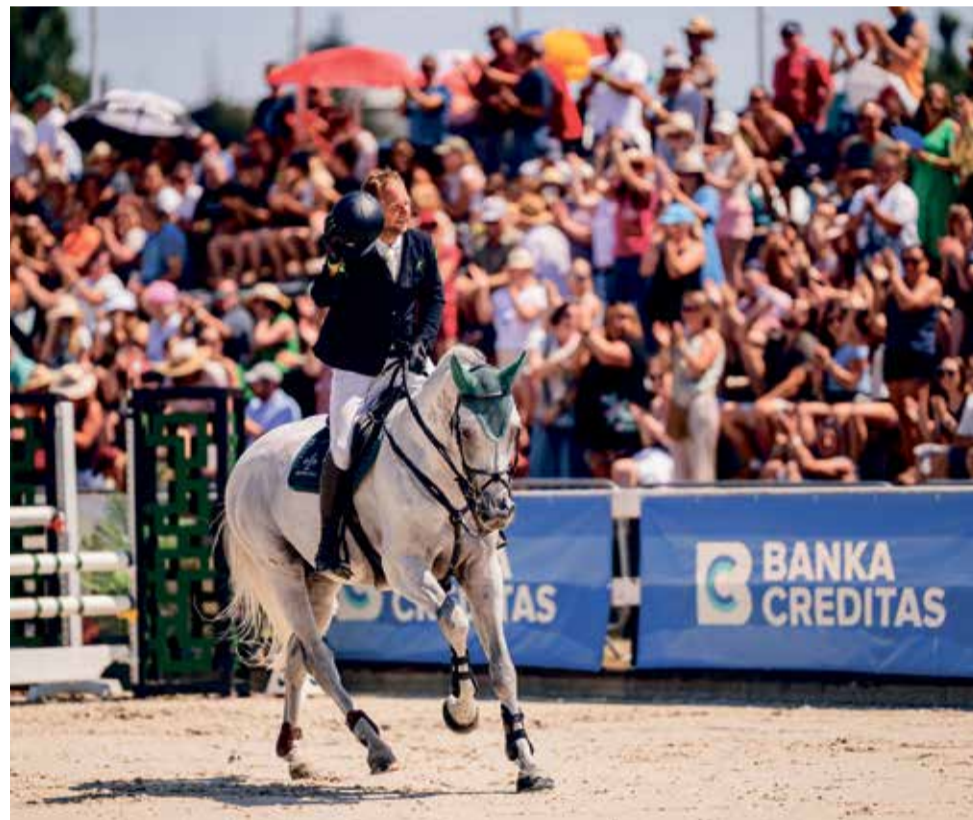
Špičkové parkurové závody se chystají v Olomouci.

Součástí Světového poháru je vždy hlavní soutěž celého mítinku - Grand Prix, která se v Olomouci pojede v neděli 21. června.