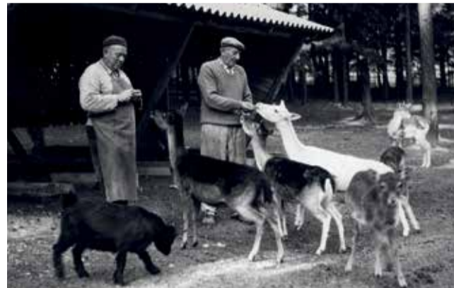
Krmení zvířat v šedesátých letech.

Olomoucká zoologická zahrada má na svém kontě také řadu významných odborných výsledků. Patří k předním evropským chovatelům přimorožců jihoafrických (přes dvě stě mláďat), vede plemennou knihu kozorožců kavkazských a je jedinou zoo v Česku s pravidelným rozmnožováním lvů berberských.