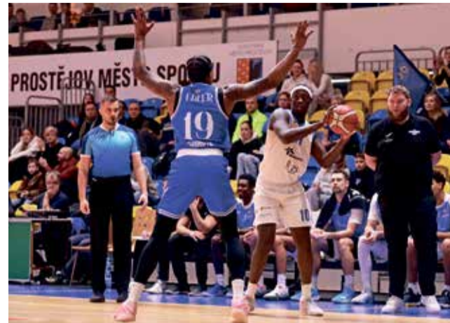
Basketbalisté BK Olomoucko vyměnili Olomouc za Prostějov.

Čajkarěna ovšem o vrcholový basketbal zcela nepříjde. V rámci úspěšně nastartované spolupráce