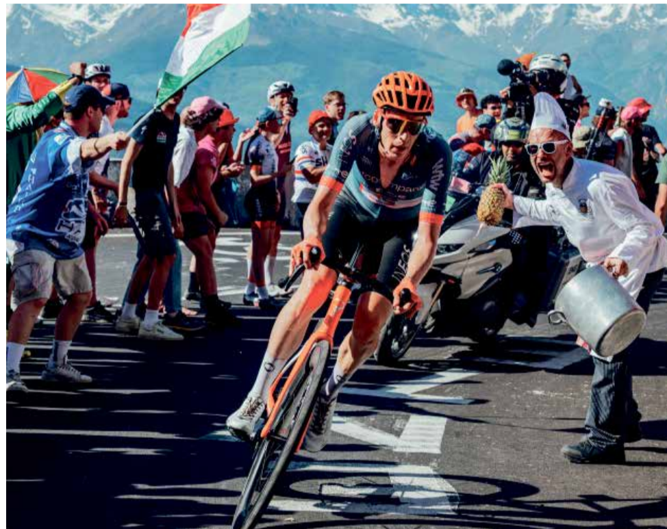
Cyklistická Czech Tour přilákala další hvězdy.