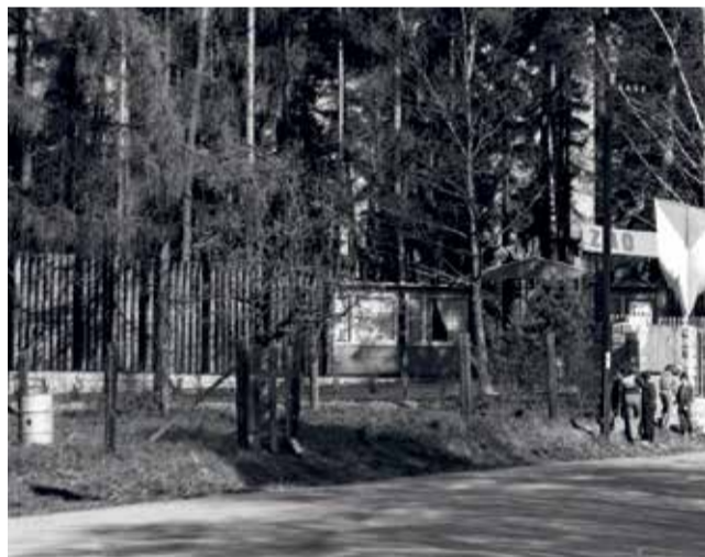
Vchod do ZOO v osmdesátých letech.

Za 70 let vývoje olomoucká zoo překonala počáteční nedůvěru, finanční těžkosti i vážné krize díky obětavosti svých zakladatelů, ředitelů a stovek dobrovolníků. Z malého lesního koutku se vypracovala na moderní instituci, která nabízí zábavu, vzdělávání i aktivní příspěvek k záchraně ohrožených druhů. K významnému jubileu chystá řadu speciálních akcí, kterými chce přilákat širokou veřejnost. Hanácký Večerník jí přeje do dalších let hodně úspěchů a spokojených návštěvníků. ■