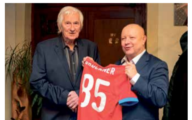
Trenér Karel Brückner slavil půlkulatiny.

Oslava nebyla pouze poutou Brücknerovým 85. narozeninám, ale také připomínkou historických úspěchů, které český fotbal zažil díky této výjimečné generaci. ■