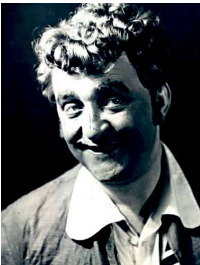
Oldřich Velen jako Sganarelle v Molièrově Donu Juanovi (1952)

Jako jedna z mála slavných hereček navíc nikdy nepřešla k divadlu do Prahy, po angažmá v Olomouci zůstala po celý život členkou činohry Národního divadla v Brně. I zde však dokázala díky prvotřídnímu charakternímu herectví získat renomé přední české divadelní herečky. Koncem sedmdesátých let musela vystupování omezit ze zdravotních důvodů, dále však v osmdesátých a devadesátých letech natáčela v televizi, dokonce se vrátila k filmu roli v Cieslarově snímku Někde je možná hezky. Vlasta Fialová zemřela těsně před svými sedmdesátými narozeninami v lednu roku 1998 v rodném Brně. ■