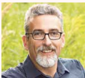
Miroslav Žbánek primátor města Olomouce

Ptejte se vedení města Olomouce na e-mailové adrese otevrenaradnice@hanackyvecernik.cz a my Váš dotaz necháme zodpovědět!