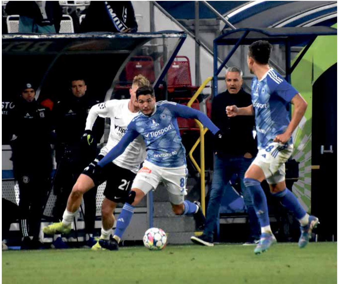
Fotbalisty SK Sigma proti Liberci potopily individuální chyby a laxní bránění.

„Zápas se mi nehodnotí lehce. Porážka 1:4 je výrazná, počet obdržných branek v domácím prostředí mě samozřejmě netěší. Pokud chceme pomýšlet na lepší výsledky, musíme se vyvarovat individuálních chyb. Do zápasu jsme šli s ambicemi zvítězit, ale to se nepodařilo. Průběh zápasu určil brzký gól, Liberec byl maximálně efektivní. My jsme sice byli na míči a v kombinaci, ale hlavně v boxu jsme byli málo nebezpeční. Hlavně v šestnáctce. Liberec vyhrál zaslouženě. Fotbal se hraje na góly,“ řekl Tomáš Janotka, trenér SK Sigma. ■