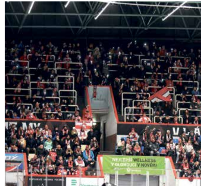
Hokejisté HC Olomouc jsou doma pevní jako skála.