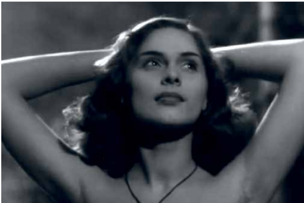
Vlasta Fialová ve filmu Divá Bára