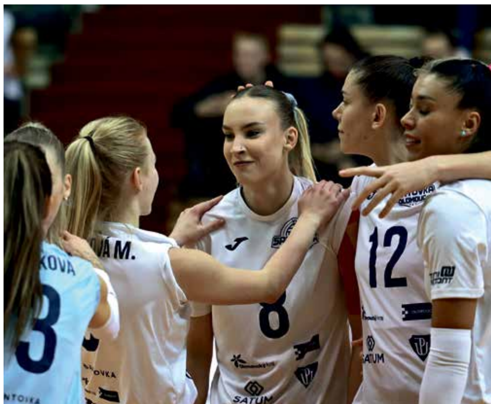
Volejbalistky VK Šantovka Olomouc stále dominují extralize.