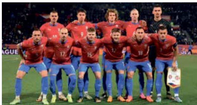
Český národní tým vybojoval v Olomouci postup.

hosté, když se po brejku dostal ke střele Kvaratskhelia, jenž vypálil levačkou na přední tyč, ale Matěj Kovář byl opět připraven a prudkou ránu vyrazil. V 60. minutě se hostům podařilo snížit, když se prosadil Mikautadze. V závěru měla Gruzie velkou převahu a mnoho šancí, domácí vše se štěstím přečkali. ■