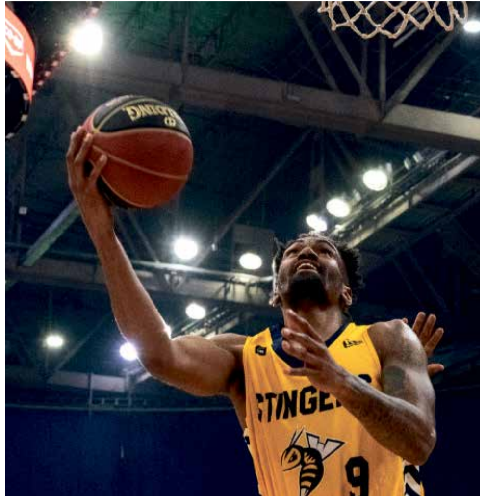
Basketbalisté BK Olomoucko mají posilu z elitní soutěže.